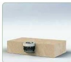
Wkładka jest gotowa do montażu.