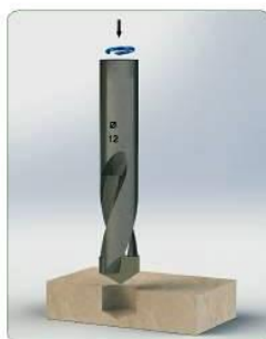
Przygotowanie otworu w materiale odbierającym.