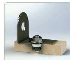
Wkładka jest konstrukcyjnie zamocowana i zamontowana.